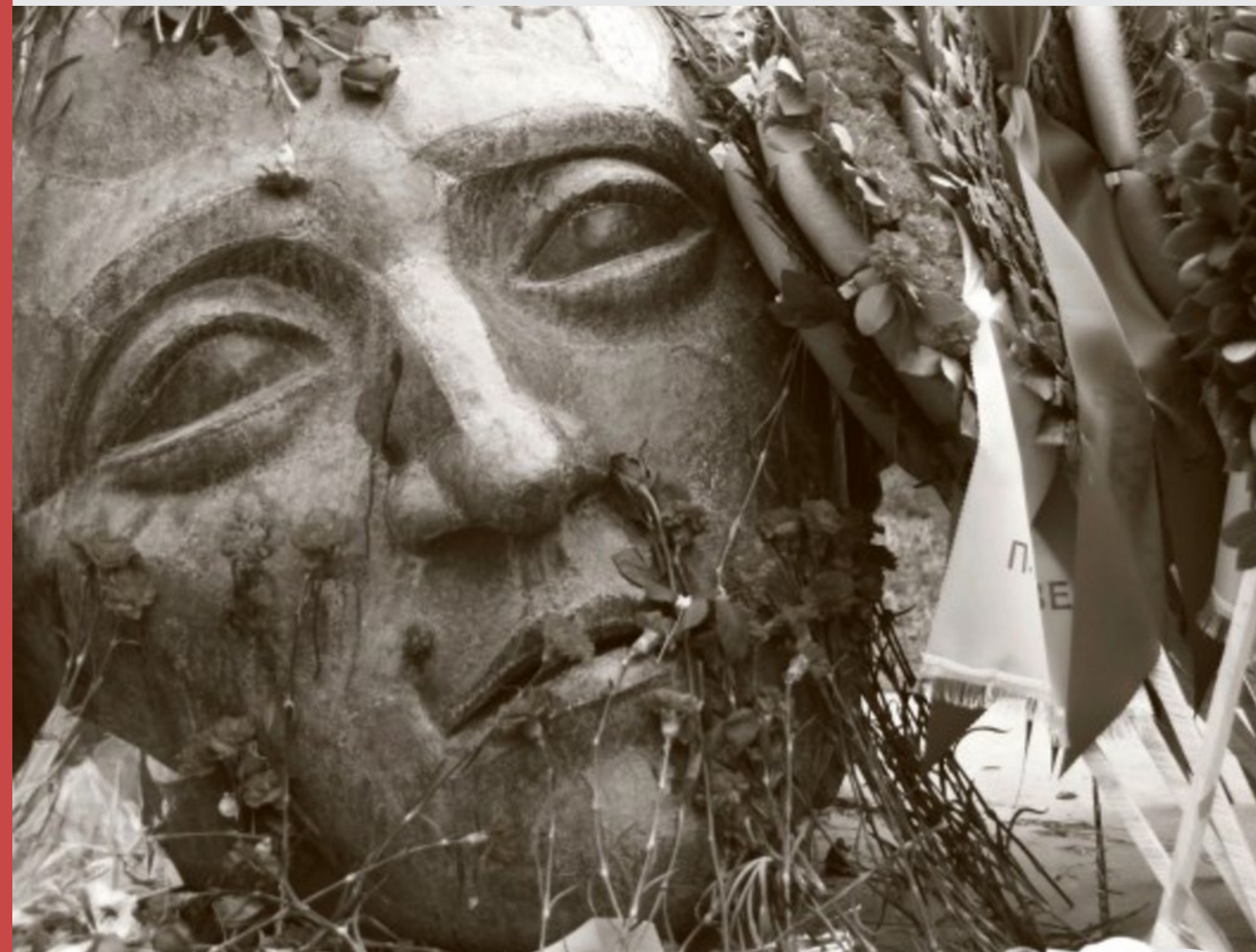
- "Νίκος Σβορώνος", το ομώνυμο γλυπτό του Μέμου Μάκρη