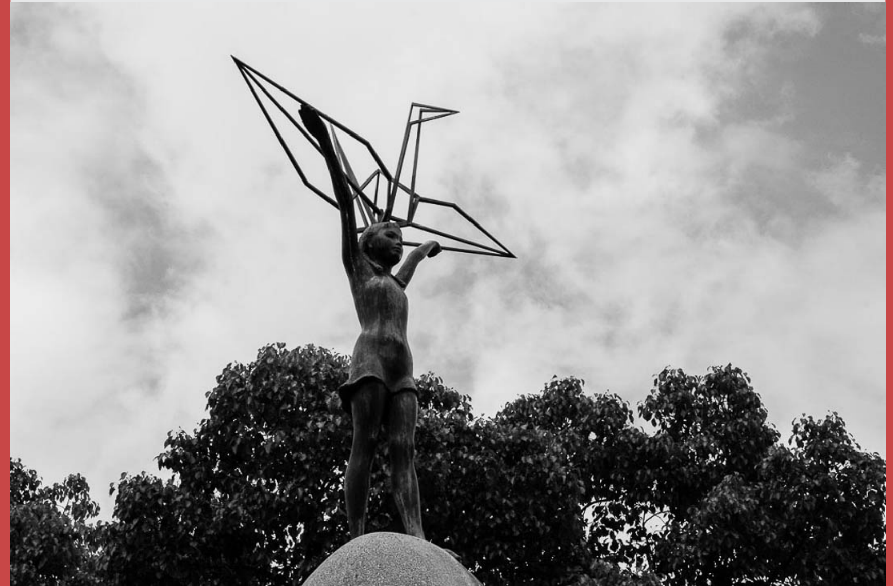
- Το γλυπτό της Sadako Sasaki, του κοριτσιού- σύμβολο της πυρηνικής βόμβας της Hiroshima και Nagasaki.